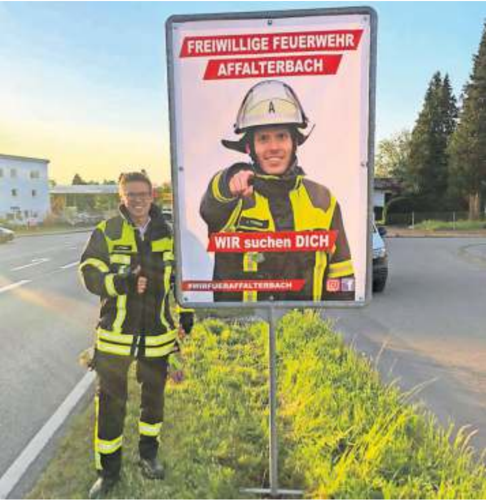
Die Männer und Frauen der Freiwilligen Feuerwehr Affalterbach sind auf der Suche nach Unterstützung.