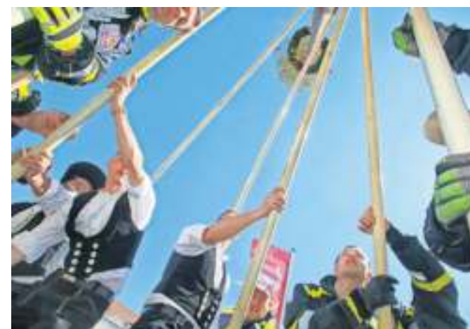
Das Aufstellen des Zunftbaums in Murr.

Bereits seit dem Jahr 2008 feiert die Gemeinde das Flößerfest. Organisiert wird es