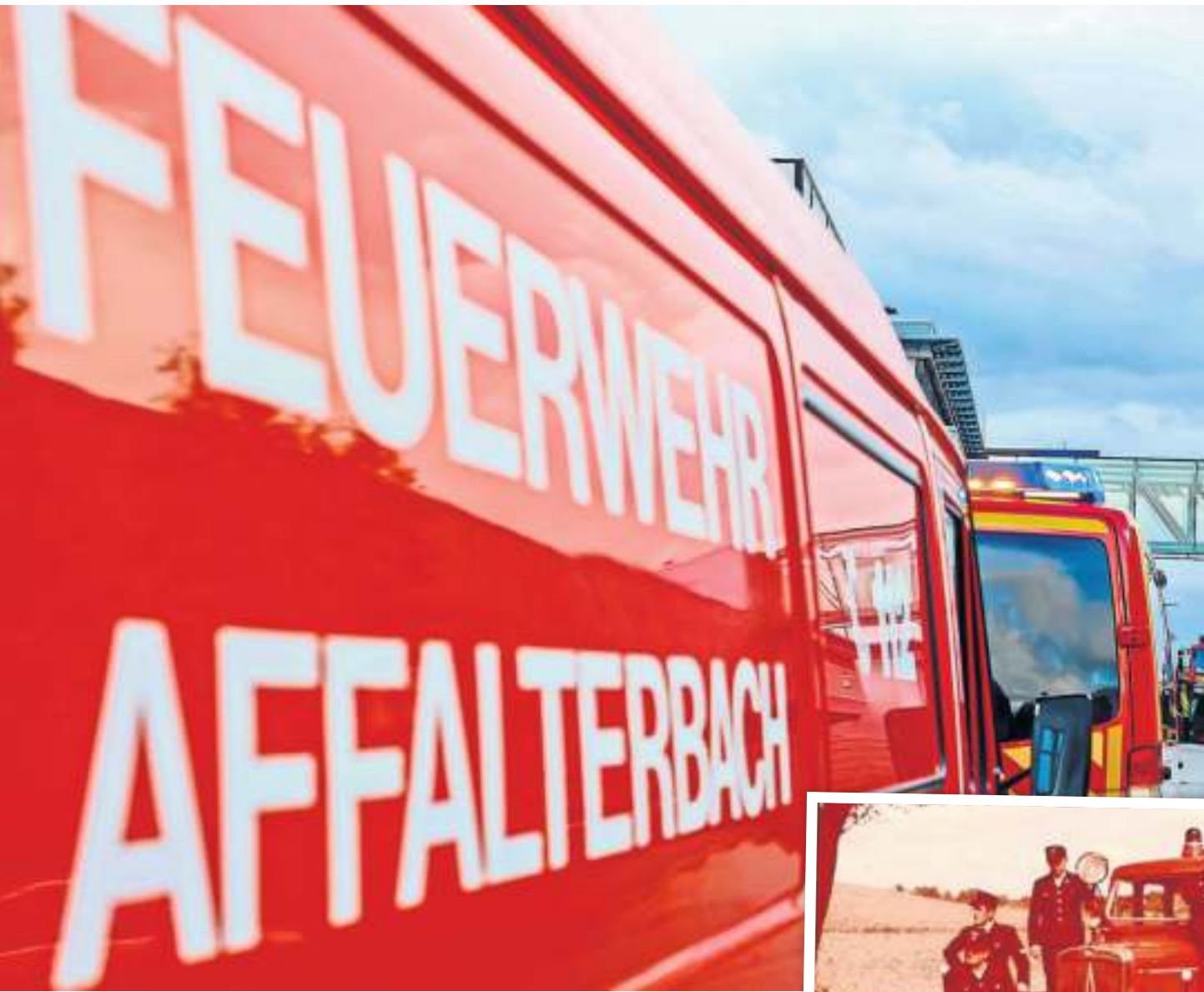
Sie feiern 150-jähriges Bestehen: Die Mitglieder der Freiwilligen Feuerwehr Affalterbach haben allen Grund, stolz zu sein.