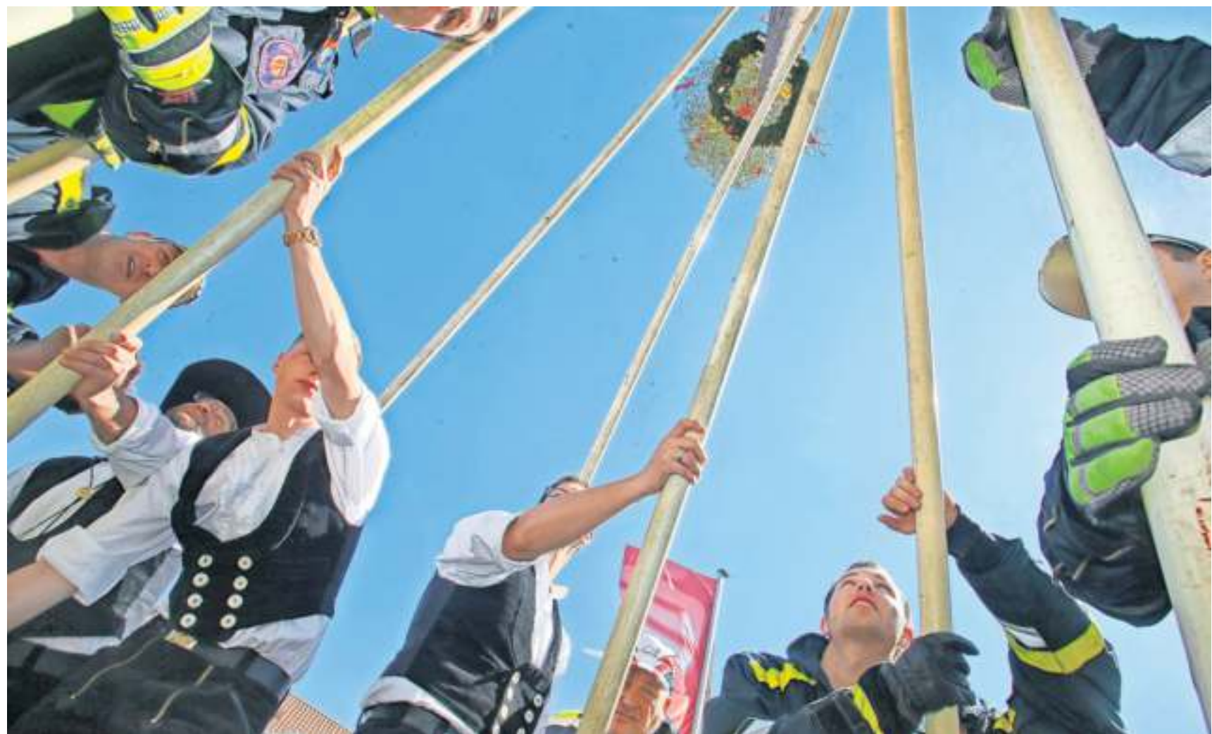
Lange wurde der Zunftbaum durch kräftige Helfer aufgestellt. Heute übernimmt diese Arbeit ein Kran.