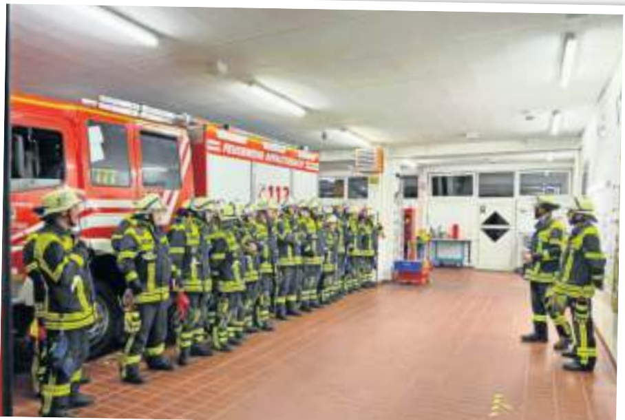
Stets einsatzbereit: Die Kameradinnen und Kameraden der Feuerwehr.