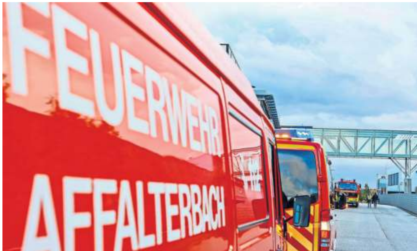
Die Freiwillige Feuerwehr Affalterbach feiert Jubiläum.

anzeigen@marbacher-zeitung.de · Telefon 07144/8500-0 · Telefax 07144/5001