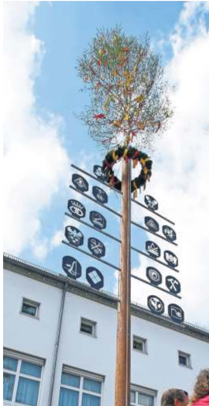
Die Schilder am Baum repräsentieren die Zünfte Murrs.

Der Schultes fügt hinzu: „Das Flößerfest erfreut sich großer Beliebtheit. Es ist in Murr traditionell das erste große Fest eines Jahres, das im Freien stattfindet.“ Er dankt besonders dem Organisationsteam: „Herzlichen Dank unserem Handels- und Gewerbeverein und allen Helfern, die das Fest organisieren und den Zunftbaum herrichten.“