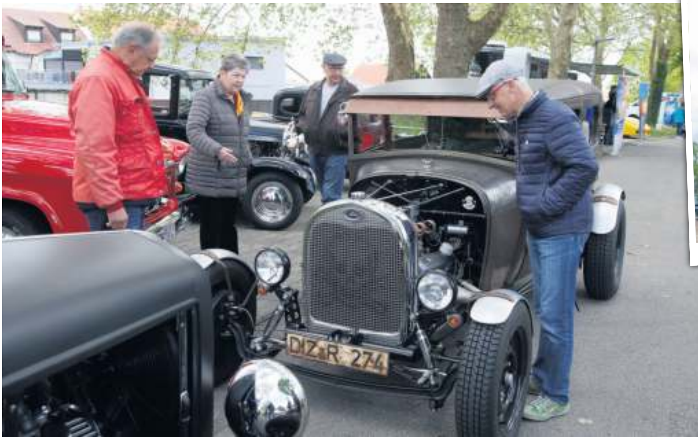
Egal ob Auto- oder Motorradliebhaber: Die „Marbacher Auto und Freizeitmesse“ hat für alle etwas zu bieten.

Auch das Programm der Messe hat sich etwas verändert. Fans des Altbewährten müssen jedoch keine Sorge haben. Es gibt nach wie vor viel Bekanntes auf dem Stadionparkplatz: Dazu zählen beispielsweise Autohäuser der Region. Zu den Ausstellern rund um Auto und Co. gesellen sich in diesem Jahr das erste Mal Fahrradhändler. Die mitgebrachten Räder und E-Bikes können vor Ort getestet werden.