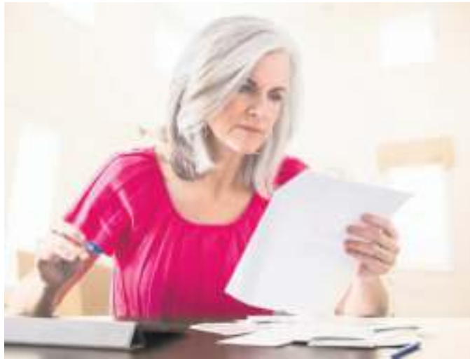
Ein Blick auf den Versicherungsschein ist immer gut.

— Hausratversicherung: Beim Braten mit heißem Öl reicht manchmal ein kurzer Augenblick, um in der Küche ein Feuer zu entfachen. „Mit einer Hausratversicherung ist das eigene Hab und Gut gegen Schäden durch Brand, Hagel, Sturm, Leitungswasser oder Einbruchdiebstahl abgesichert“, so die Expertin. Über zusätzliche Bausteine lässt sich bei vielen Anbietern der Schutz beispielsweise mit einer extra Glas- oder Fahrradversicherung erweitern. „Auch der Einschluss von weiteren