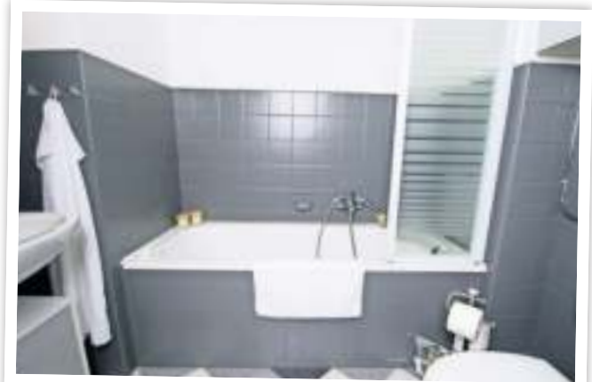
Neue Farben bringen wohnliches Flair ins Badezimmer.