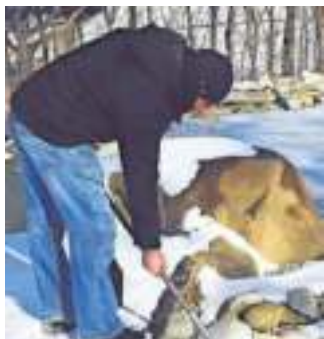
Auch der Teich macht Winterschlaf.

■ MARBACH/BOTTWARTAL Wenn die Temperaturen dauerhaft unter zehn Grad Celsius sinken, ist es Zeit, den Gartenteich auf die kommenden kalten Monate vorzubereiten. Fische nicht mehr füttern! Gefrierendes Wasser dehnt sich aus und kann dabei einen starken Druck entwickeln, unter dem die technischen, nicht frostsicheren Geräte im Biotop leiden. Daher sollten Teichfreunde Teichpumpe, Wasserspeier und Fontänen rechtzeitig vor Einsetzen des Frostes ausschalten, leerlaufen lassen, reinigen und in einem Behälter mit Wasser und Pflegemitteln frostfrei aufbewahren. Im Herbst weht zu dem viel Laub in das Teichwasser, das auf den Teichgrund sinkt und zu Faulschlamm mit gefährdeten Faulgasen wird. Daher ist es besser, mindestens alle zwei Tage die Blätter mit einem Kescher aus dem Wasser abzufischen und möglichen Faulschlamm mit einem geeigneten Sauger vom Teichgrund zu entfernen. Die Fische ziehen sich in den Wintermonaten in die tieferen Teichebenen zurück, ihr Stoffwechsel kommt weitgehend zum Erliegen, sie fallen in eine Art Winterstarre. Lediglich Sauerstoff benötigen sie weiterhin. Neben der Unterstützung mit technischen Geräten sorgen auch wintergrüne Unterwasserpflanzen oder Röhrrieh für die notwendige Sauerstoffproduktion und den Gasaustausch. djd