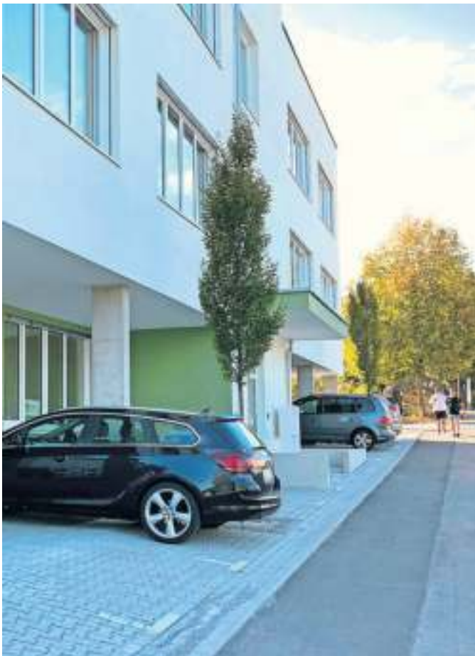
Ein Standort mit vielen Vorteilen..