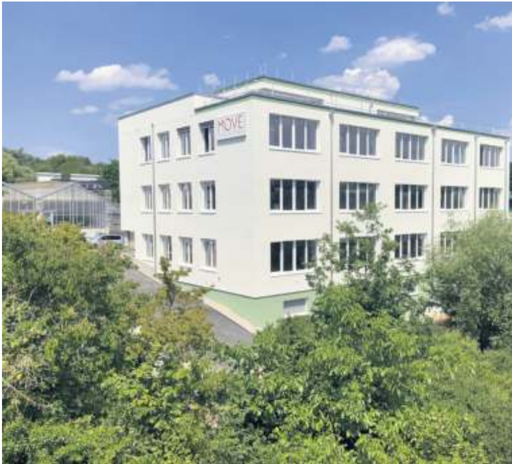
Das neue Gebäude liegt verkehrsgünstig und ist besonders energiesparend.

Doch wer bald einziehen möchte, sollte schnell sein und sich kurzfristig beim Marbacher Immobiliendienst informieren. Vier der sieben Einheiten sind bereits vermietet und vergeben. Wer also Interesse hat, sollte sich bald mit Jürgen Kiefer in Verbindung setzen. Der alteingesessene und erfahrene Immobilienprofi für Wohn- wie auch Gewerbeimmobilien gestaltet gerne mit den zukünftigen Mietern die Feinheiten und Details für deren optimale Nutzung.