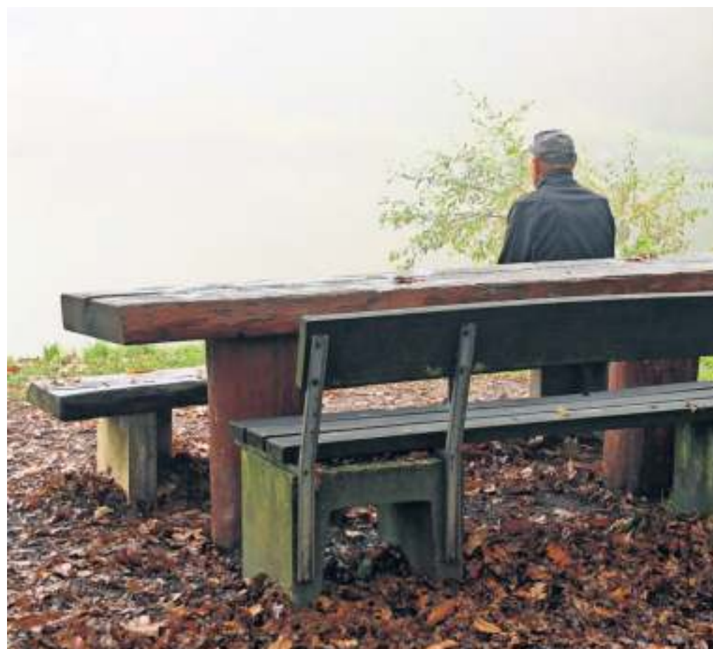
Ein Anzeichen für eine Trauerstörung kann sein, dass die Trauer lang anhaltend den Alltag der Betroffenen einschränkt.