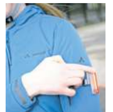
Reflektoren erhöhen die Sicherheit.

erhöhen, etwa das rote Blinklicht hinten am Rucksack oder im Fahrradhelm. Wer bei Dunkelheit oder schlechten Sichtverhältnissen auf dem Fahrrad ohne Licht fährt oder eine nicht funktionierende Beleuchtung hat, zahlt 20 Euro Bußgeld. Kommen Gefährdung oder Sachbeschädigung hinzu, kann das Verwarnungsgeld auch höher ausfallen. Mit der hohen Helligkeit heutiger Leuchten kommt es auch darauf an, dass das Vorderlicht korrekt eingestellt ist, um andere Verkehrsteilnehmer, etwa Fußgänger, nicht zu blenden. Zudem reduzieren falsch eingestellte Fahrradlampen die Lichtausbeute. Reflektoren am Fahrrad sowie helle und reflektierende Kleidung erhöhen die Sicherheit ebenfalls. Der Fachhandel bietet auch reflektierende Rucksäcke oder Packtaschen an. Reflektierende Ärmel und Handschuhe wiederum machen Handzeichen im Dunklen besser sichtbar. Sinnvoll sind zudem Reflexbänder mit Klettverschluss. Auf Höhe der Fußknöchel angebracht schließen sie nicht nur die Hosenbeine dicht ab und verhindern, dass deren Stoff mit der Fahrradkette in Berührung kommt, sondern so sorgt die typische Bewegung der Füße auf den Pedalen für starke Auffälligkeit bei Dunkelheit. am