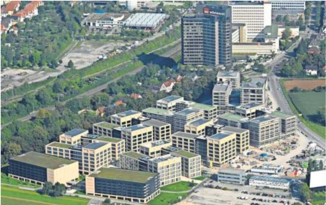
Blick auf das Wüstenrot-Quartier: Hier entstehen, wie an vielen anderen Orten im Landkreis, neue Wohnungen.

Auch das Gebiet „Sonnenberg Süd-West“ wurde neu überplant. Südlich der bestehenden Caerphillystraße will die Stadt Ludwigsburg nun auf circa 4000 Quadratmeter neue Wohnbauflächen ausweisen. In Bietigheim-Bissingen sollen auf dem 1,6 Hektar großen ehemaligen Betriebsgelände der Firma Elbe und Umgebung neue Wohn- und Gewerbeflächen geschaffen werden. Rund 2,3 Hektar misst das Neubaugebiet „Nördliche Zügelstraße“ in Kornwestheim, geplant sind 180 und 195 neue Wohnungen. In Oberstenfeld sollen im neuen Stadtteil Bottwarwiesen 1300 Menschen ein Zuhause finden. Weitere Neubaugebiete wollen diese Städte und Gemeinden anbieten: Hinter