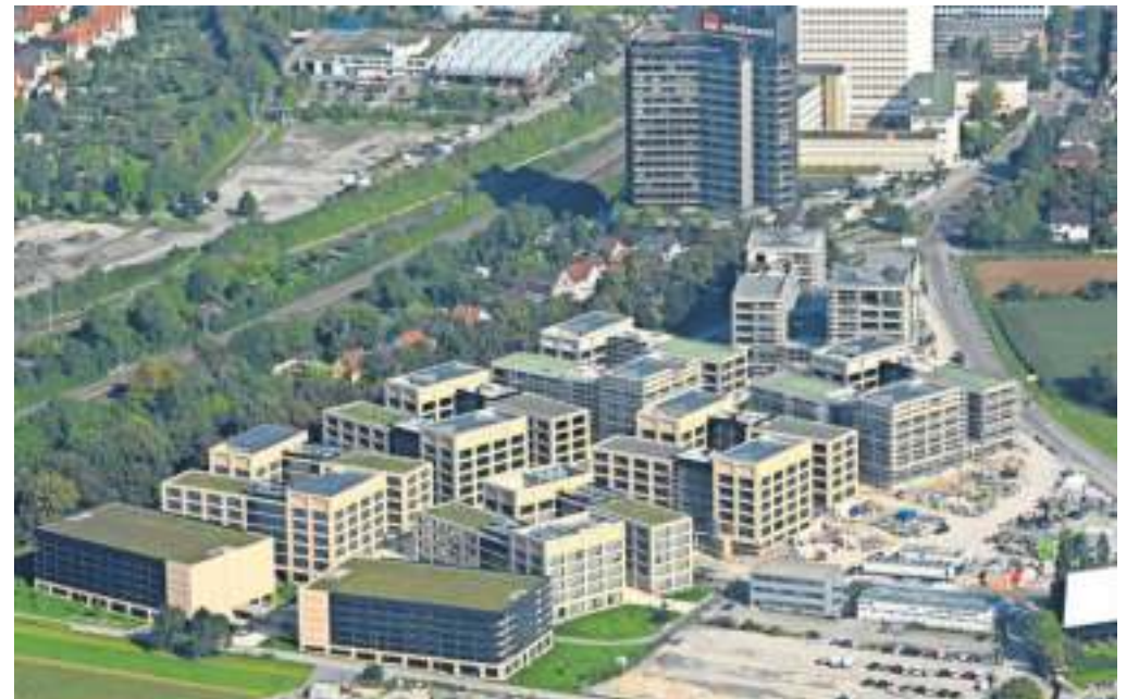
Blick auf das Wüstenrot-Quartier: Hier entstehen, wie an vielen anderen Orten im Landkreis, neue Wohnungen.

Den vollständigen Artikel zur Immobilienlage im Landkreis Ludwigsburg finden Sie im Innenteil der heutigen Ausgabe des Marbacher Stadtanzeigers.