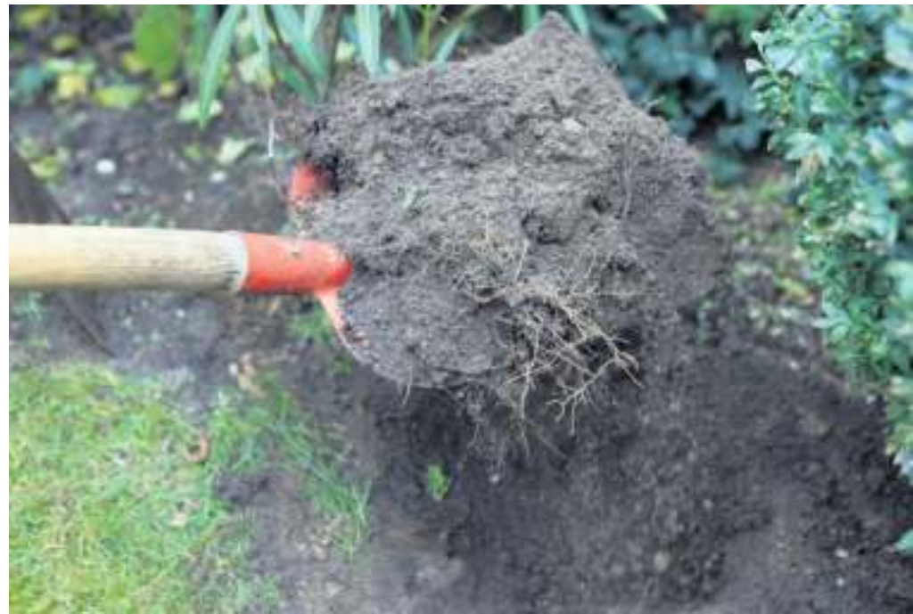
Ideal für den Bodenist eine Mischung aus Lehm- und Sandanteilen.