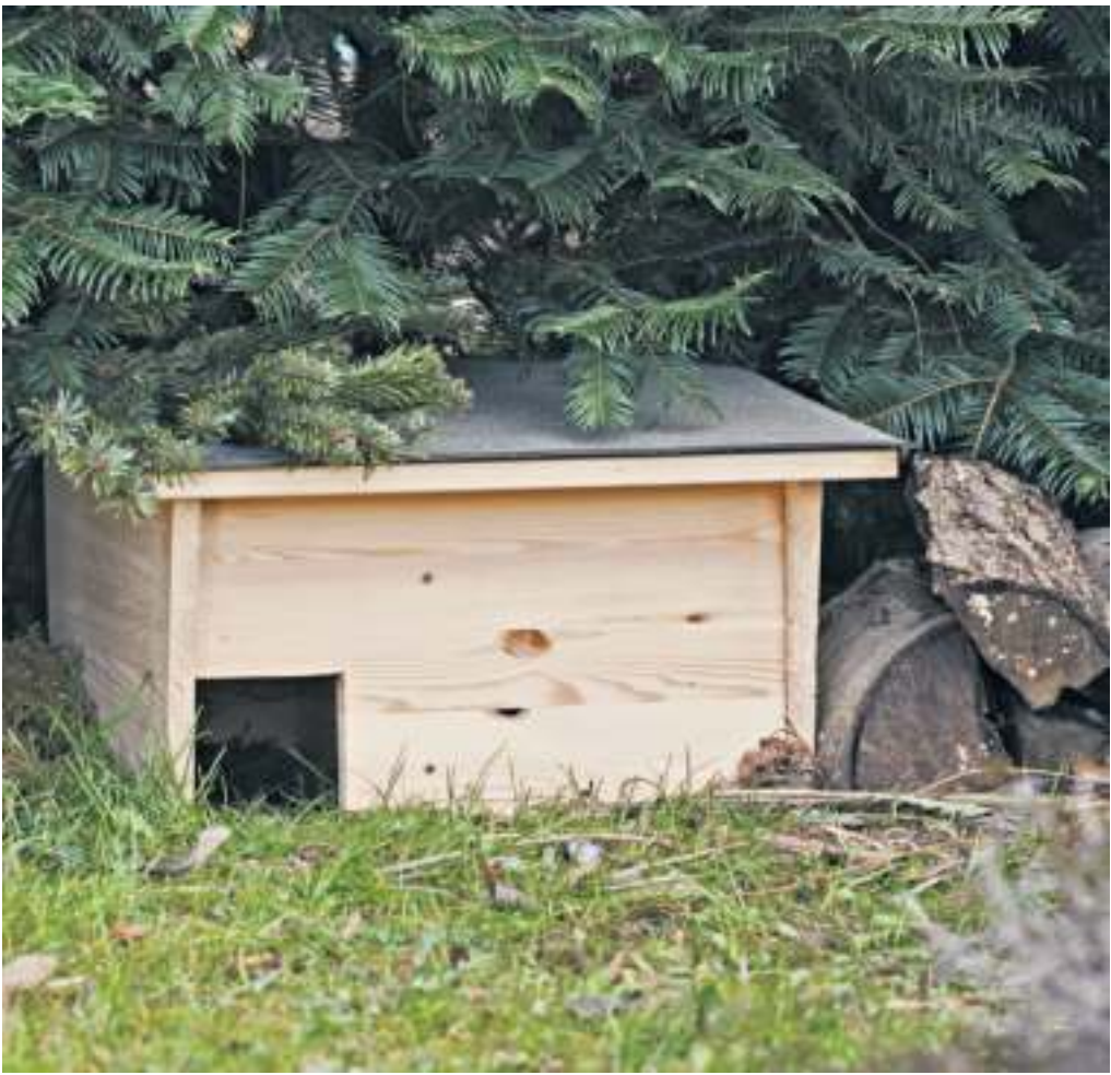
Nachhaltig gärtnern: Igel werden die Einladung in das ruhige Winterquartier dankbar annehmen.

Noch etwas: Während Sand wie ein wohltuendes Peeling für die Haut ist und das Gärtnern „eine schöne glatte Haut“ mache, sind „die Partikel von Lehm Böden eckig und kantig“, erklärt Van Groenigen. „Durch sie entstehen beim Gärtnern viele mikroskopisch kleine Verletzungen an den Händen. Man sieht kein Blut, aber die Haut reißt ein. Man merkt hinterher beim Anziehen von Kleidern, dass der Stoff leicht hängen bleibt. Gärtner tun man viel, ist das unangenehm – mein Tipp: Handschuhe tragen.“