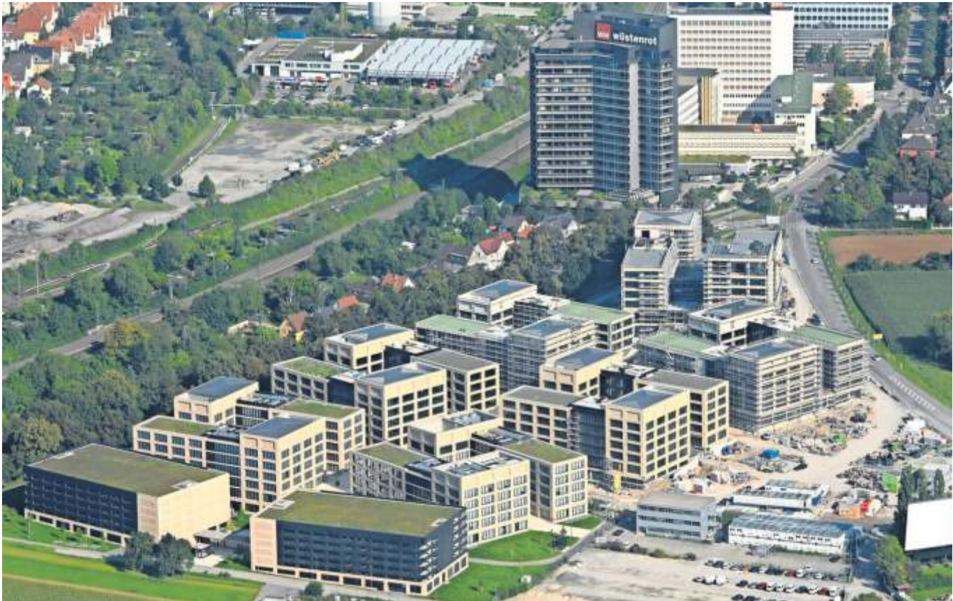
Blick auf das Wüstenrot-Quartier: Hier entstehen, wie an vielen anderen Orten im Landkreis, neue Wohnungen.

Auch das Gebiet „Sonnenberg Süd-West“ wurde neu überplant. Südlich der bestehenden Caerphillystraße will die Stadt Ludwigsburg nun auf circa 4000 Quadratmeter neue Wohnbauflächen ausweisen. In Bietigheim-Bissingen sollen auf dem 1,6 Hektar großen ehemaligen Betriebsgelände der Firma Elbe und Umgebung neue Wohn- und Gewerbeflächen geschaffen werden. Rund 2,3 Hektar misst das Neubaugebiet „Nördliche Zügelstraße“ in Kornwestheim, geplant sind 180 und 195 neue Wohnungen. In Oberstenfeld sollen im neuen Stadtteil Bottwarwiesen 1300 Menschen ein Zuhause finden. Weitere Neubaugebiete wollen diese Städte und Gemeinden anbieten: Hinter