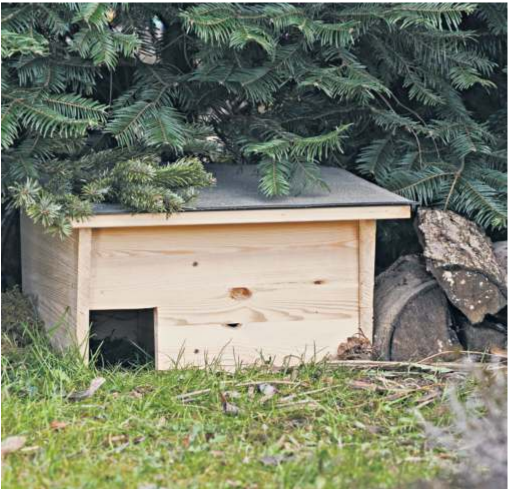
Nachhaltig gärtnern: Igel werden die Einladung in das ruhige Winterquartier dankbar annehmen.

Noch etwas: Während Sand wie ein wohltuendes Peeling für die Haut ist und das Gärtnern „eine schöne glatte Haut“ mache, sind „die Partikel von Lehm Böden eckig und kantig“, erklärt Van Groenigen. „Durch sie entstehen beim Gärtnern viele mikroskopisch kleine Verletzungen an den Händen. Man sieht kein Blut, aber die Haut reißt ein. Man merkt hinterher beim Anziehen von Kleidern, dass der Stoff leicht hängen bleibt. Gärtner man viel, ist das unangenehm – mein Tipp: Handschuhe tragen.“