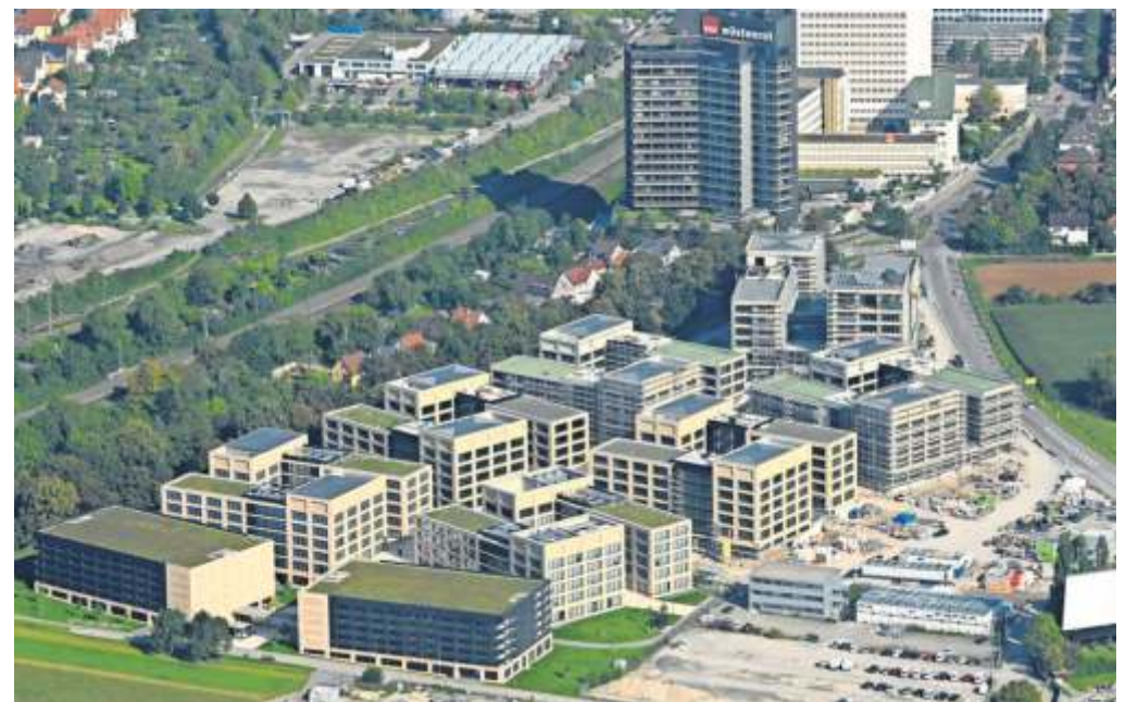
Blick auf das Wüstenrot-Quartier: Hier entstehen, wie an vielen anderen Orten im Landkreis, neue Wohnungen.

Den vollständigen Artikel zur Immobilienlage im Landkreis Ludwigsburg finden Sie im Innenteil der heutigen Ausgabe des Marbacher Stadtanzeigers.