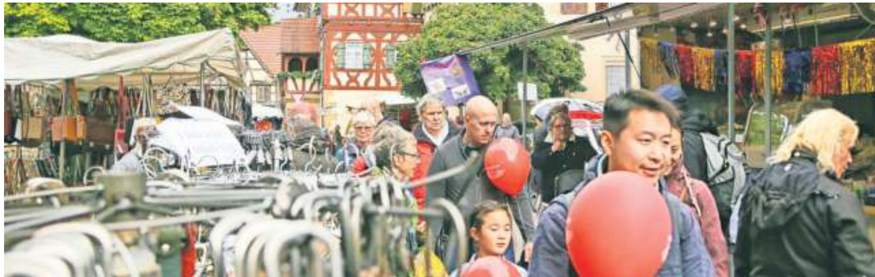
Beim verkaufsoffenen Sonntag in Steinheim sind dieses Jahr auch wieder viele Vereine mit von der Partie.