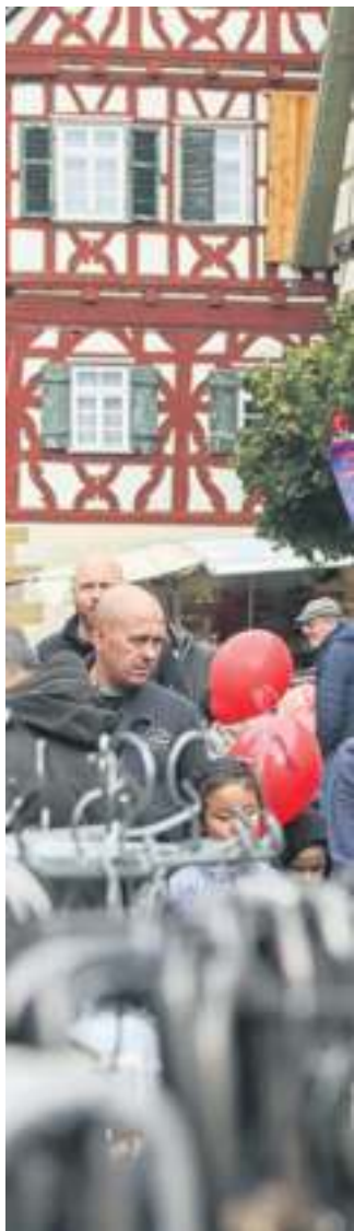
Freude und Kurzweil für alle.

Am 17. September ist in Steinheim von 12 bis 17 Uhr mächtig was los