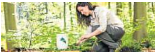
Manche Urnen können im Waldboden verbleiben.