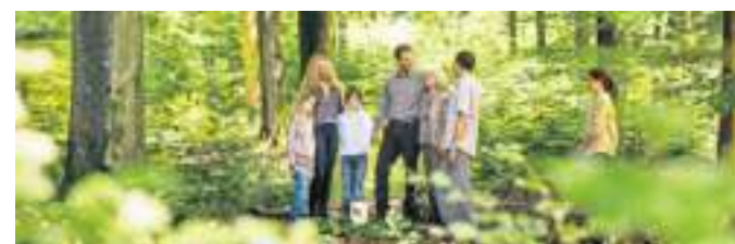
Trauerfeiern sind in jedem Rahmen von Bedeutung.