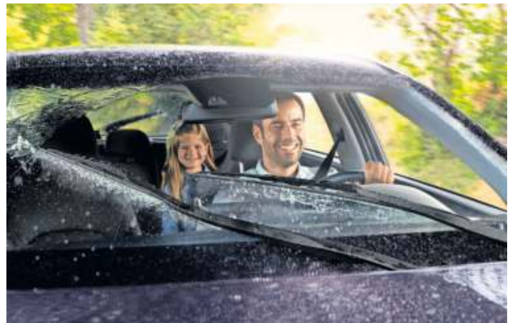
Gute Sichtbarkeitsverhältnisse gehören zum Sicherheits-Check für die kalte Jahreszeit dazu.

sollte eine Selbstverständlichkeit sein – denn ein rechtzeitiger Austausch kann ärgerliche Pannen vermeiden. Noch wichtiger ist der Zustand der Versorgungsbatterie bei den immer beliebteren Elektroautos. Im Sommer wird diese stark beansprucht und droht dann, in der kalten Jahreszeit auszufallen. Fachwerkstätten können den aktuellen Zustand einfach prüfen. Wenn die Batterie schwächelt, ist die Gefahr vorhanden, liegenzubleiben. Ein Kompletttausch ist nicht immer erforderlich. Hochvolt-geschulte Werkstätten können gealterte Module durch neue langlebige Nickel-Metallhydrid-Module ersetzen. djd