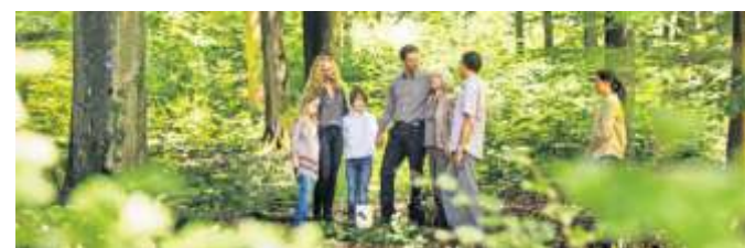
Trauerfeiern sind in jedem Rahmen von Bedeutung.