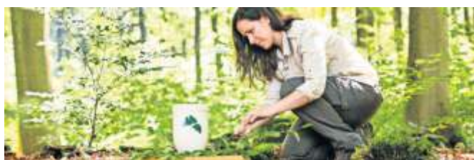
Manche Urnen können im Waldboden verbleiben.