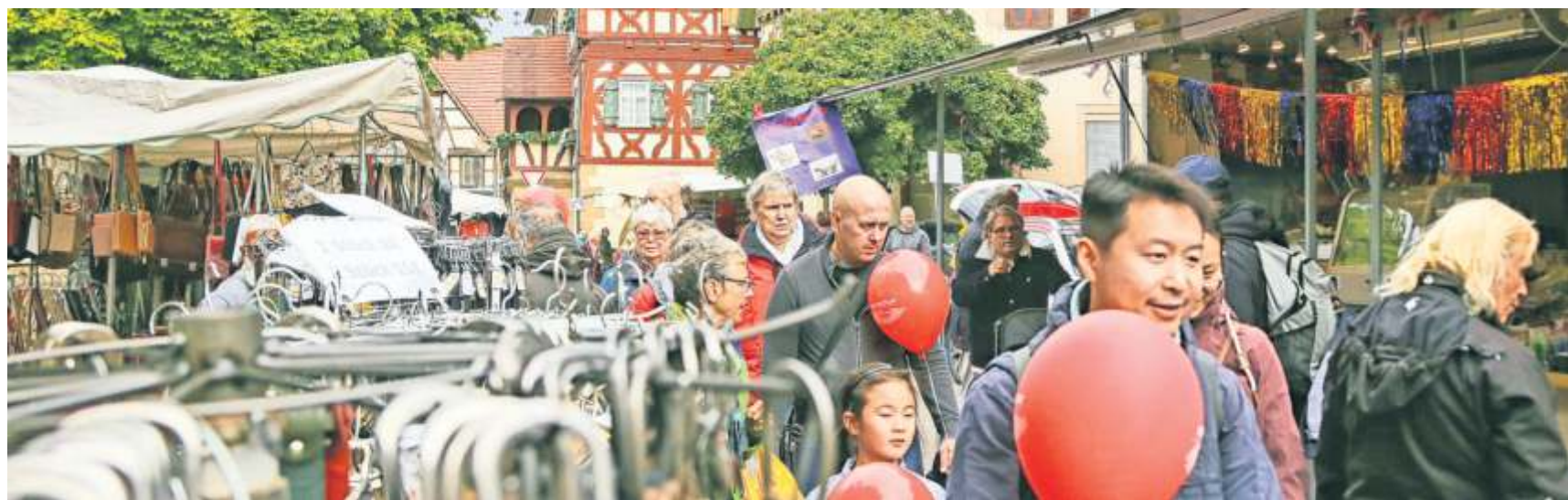
Beim verkaufsoffenen Sonntag in Steinheim sind dieses Jahr auch wieder viele Vereine mit von der Partie.