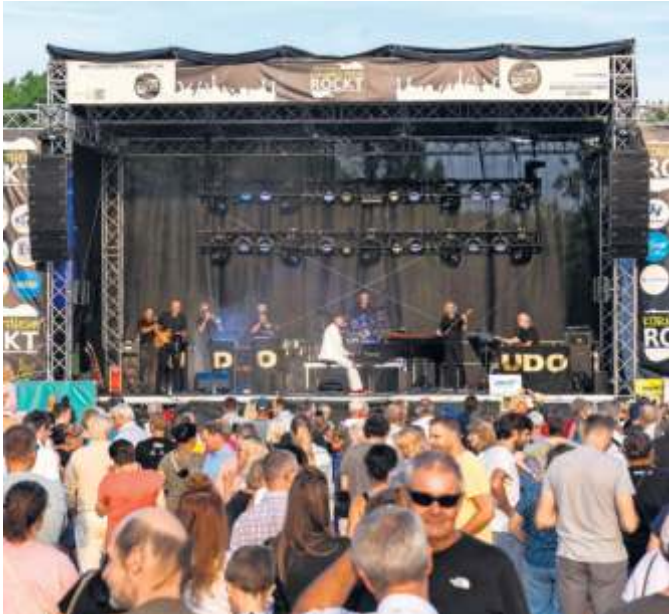
Bei „Kornwestheim rockt“ gibt es jeden Dienstag im August eine andere Tribute-Band zu sehen – und das völlig kostenlos.

anzeigen@marbacher-zeitung.de · Telefon 07144/8500-0 · Telefax 07144/5001