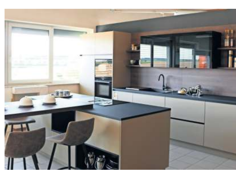
Eine Küche ist so individuell wie die Lebenswelten der Menschen. Expertise ist daher bei der Planung und Umsetzung besonders wichtig-