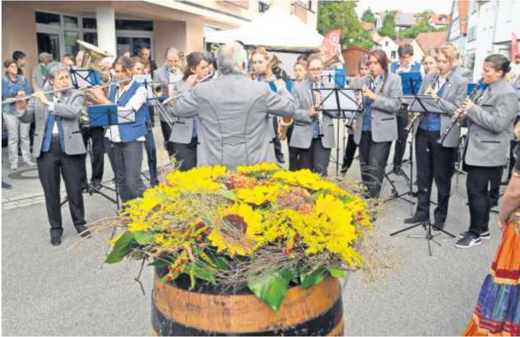
Erdmannhausen freut sich auf drei Tage Straßenfest am nächsten Wochenende.