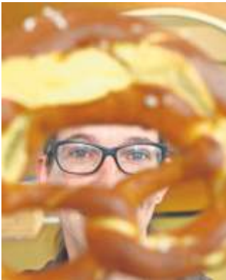
Durch die Brezel betrachtet. . .

Musikfreunde kommen gleich an drei Orten auf ihre Kosten: beim Musikverein beginnt wie beim Skiclub die