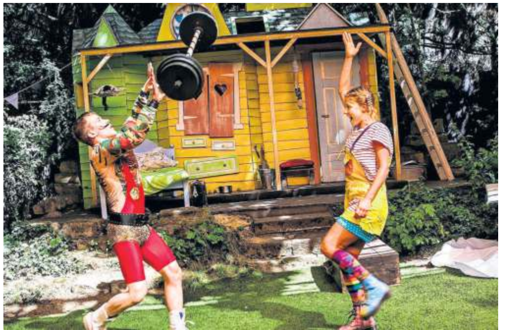
Pippi Langstrumpf ist auch dieses Jahr im Cluss'schen Garten in Ludwigsburg beim Theatersommer zu finden.

Eine Besonderheit unter den vielen Stadt- und Dorffesten des Landkreises ist der Markgröninger Schäferlauf: Die Deutsche UNESCO-Kommission hat 2018 den Schäferlauf als „immaterielles Kulturerbe“ gewürdigt. Seine Wurzeln reichen bis in das 16. Jahrhundert zurück, die Mischung aus Tradition und Volksfest fasziniert jährlich Ende August rund 100 000 Besucherinnen und Besucher. 2023 findet der