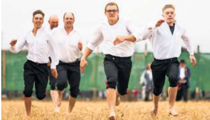
Echte Schäfer laufen barfuß.

Schäferlauf vom 25. bis 28. August statt. Die Hauptattraktion des Festes sind das Wettrennen der Schäferinnen und Schäfer barfuß über ein Stoppelfeld über eine Distanz von 300 Schritten so-