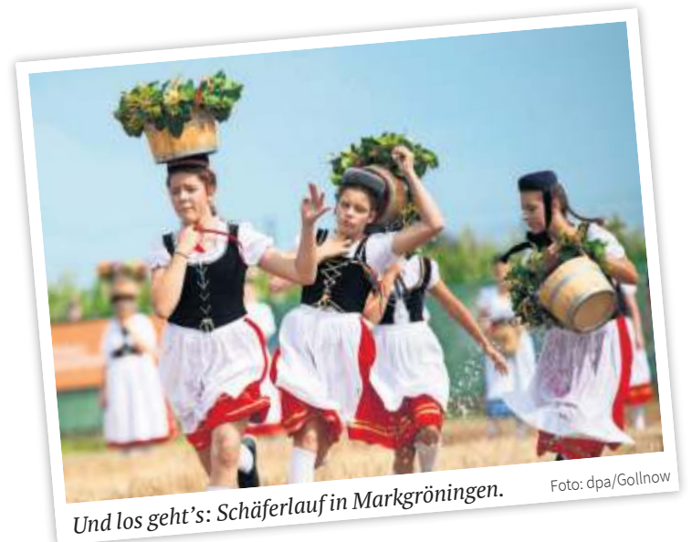
Und los geht's: Schaeferlauf in Markgröningen.

Übrigens: Auch an einen weiteren berühmten Marba-cher, den Astronomen, Karto-grafen und Mathematikers To-bias Mayer, erinnert Marbach in diesem Jahr anlässlich sei-