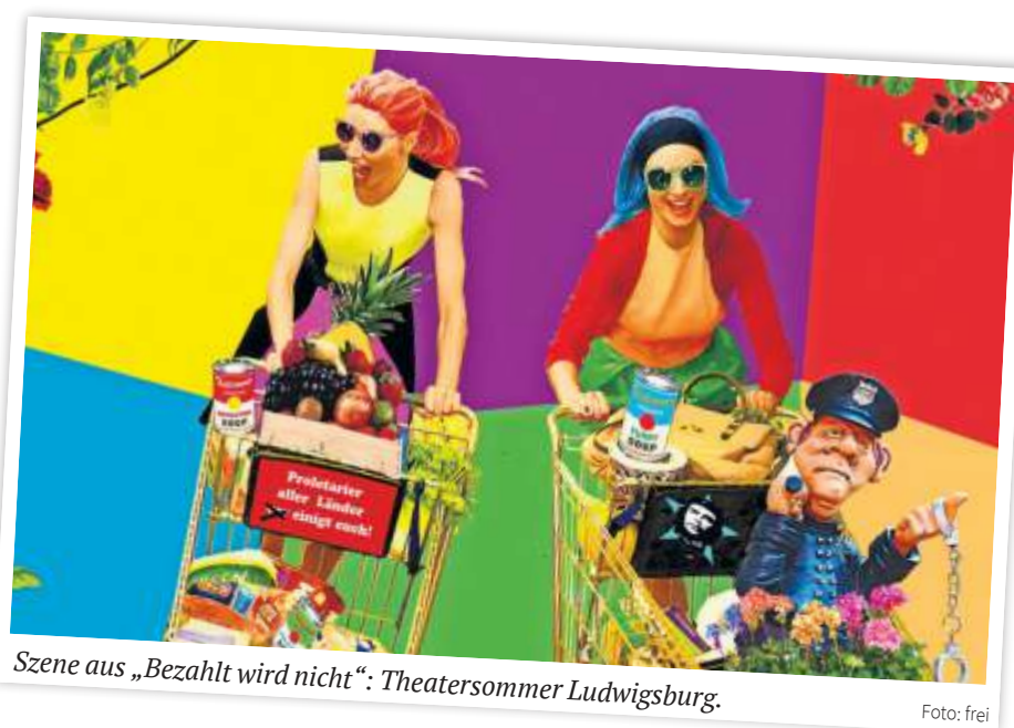
Szene aus „Bezahlt wird nicht“: Theatersommer Ludwigsburg.

Eröffnet wurde das K im September 2013. Das moderne Gebäude zwischen Rathaus und Stadtpark bietet flexibel gestaltbare Räumlichkeiten,