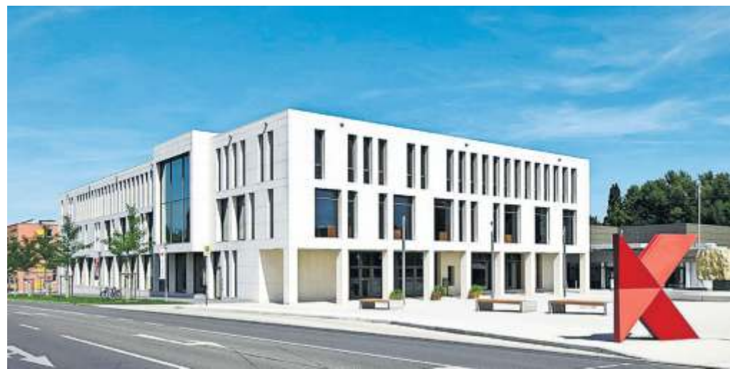
Das K, Kultur- und Kongresszentrum der Stadt Kornwestheim.

Weitere Infos unter https://www.schaeferlauf-markgroeningen.de/startseite