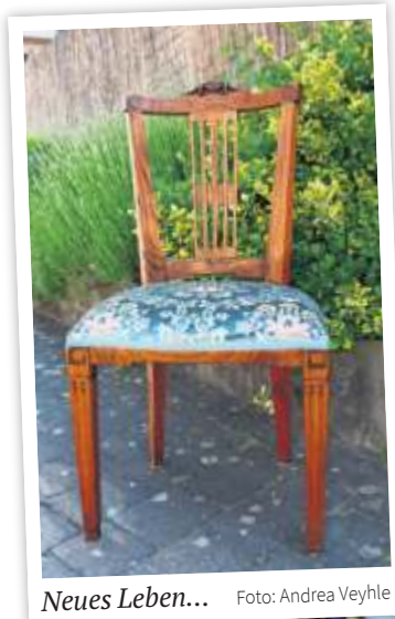
Neues Leben...