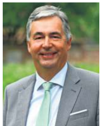
Landrat Dietmar Allgaier

Neugierig geworden? In der Sonderveröffentlichung zu „50 Jahre Landkreis Ludwigsburg“ im Innenteil finden Sie das komplette Interview mit Landrat Dietmar Allgaier.