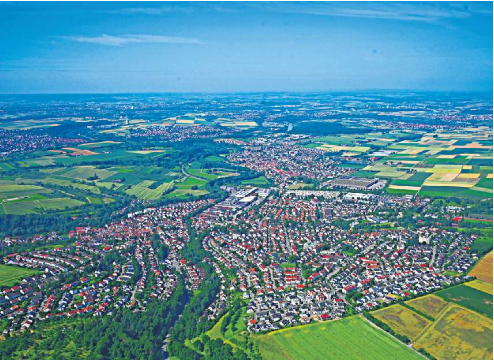
Steinheim an der Murr – der Eingang zum Bottwartal – von oben.