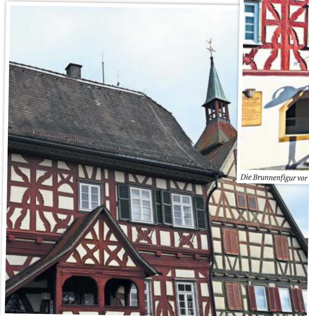
Viele Gebäude in Steinheim sind hunderte Jahre alt – so auch das Rathaus.