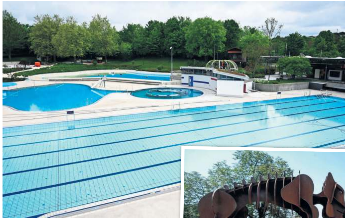
Erholung pur für große und kleine Besucherinnen und Besucher bietet das Mineralfreibad Wellarium.