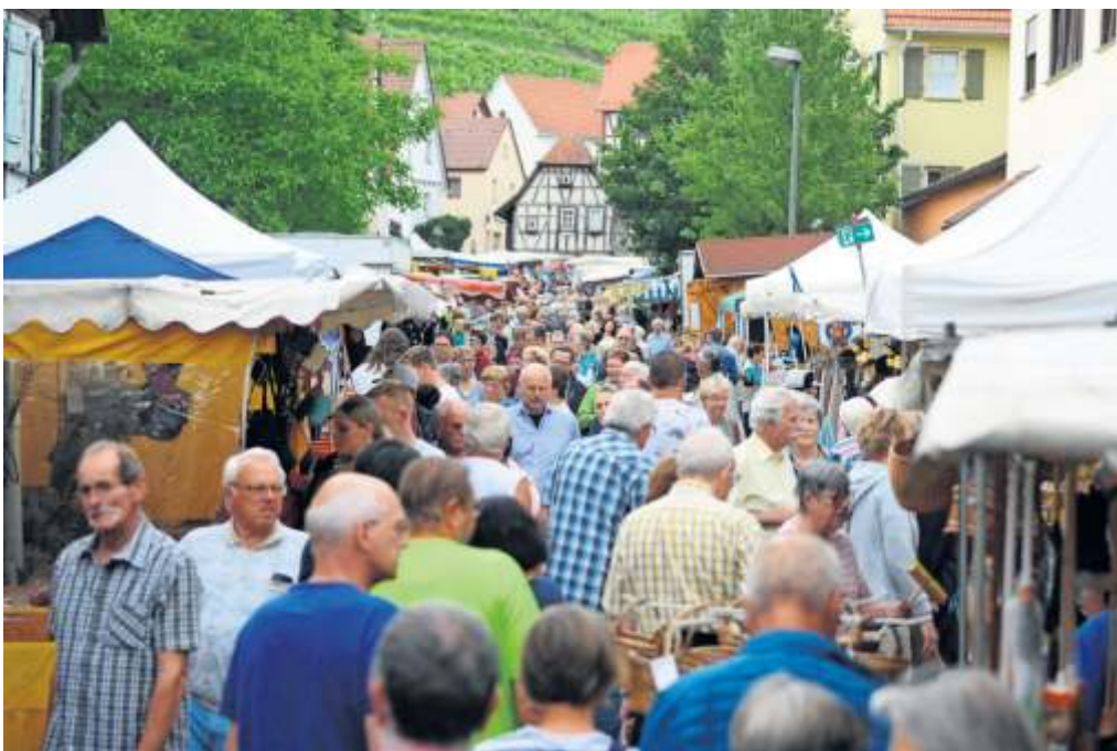
Am Montag ist Pfingstmarkt in Mundelsheim.

Mehr Informationen zum Pfingstmarkt in Mundelsheim gibt es im Innenteil.