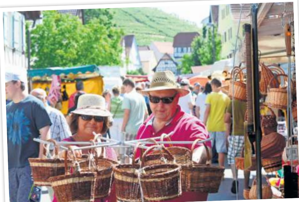
Stöbern ist angesagt beim Mundelsheimer Pfingstmarkt.

„Diese gelungene Mischung zwischen geschäftigem Treiben, guter Unterhaltung und gastfreundlicher Bewirtung wird zu einem ganz besonderen Erlebnis und an diesem Tag der Treffpunkt im Neckartal“, sagt der Mundelsheimer Bürgermeister Boris Seitz. Er fügt hinzu: „Wir wünschen allen Besuchern viel Spaß beim Bummeln, Entdecken und Genießen.“ pm