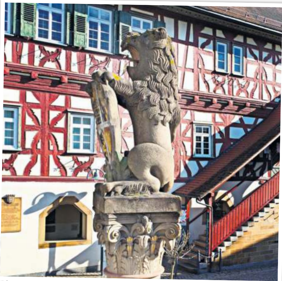
Die Brunnenfigur vor dem Steinheimer Rathaus.