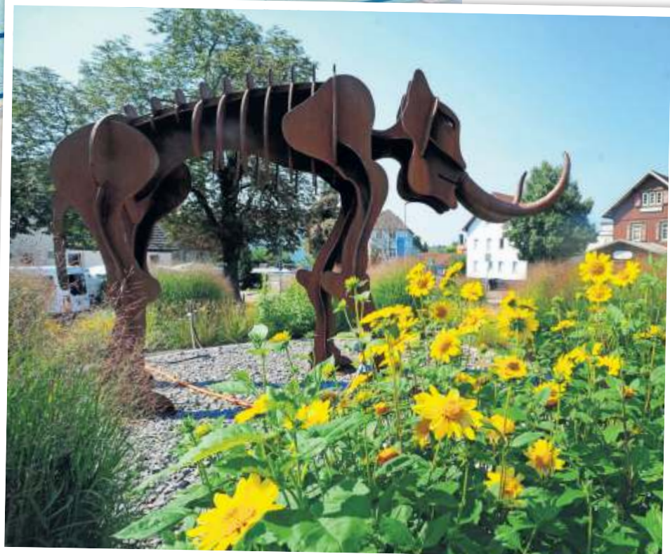
„Steppi“ auf dem Kreisel.

Radfahrerinnen und Radfahrer finden in und um Steinheim zudem ihr Glück. Sie können mit dem Rad die Landschaft erkunden oder sich auf der Pumptrack Anlage, die sich hinter dem Parkplatz P3 des Wellariums befindet, auspowern. Die Bahn ist mit Wellen und Steilwandkurven ausgestattet. Anfängerinnen und