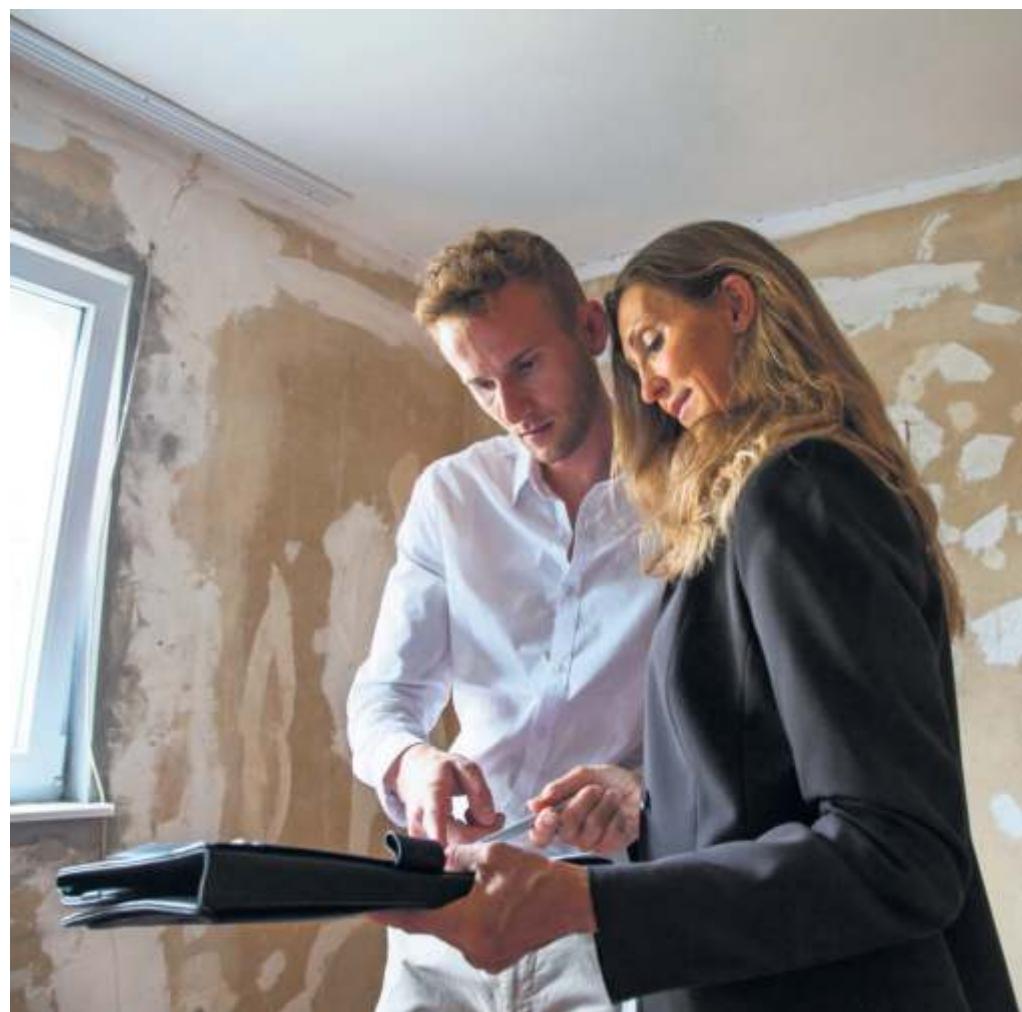
Eine Energetische Sanierung sollte von der Energieberaterin geplant werden. Dann gibt es auch staatliche Förderung.

Steinfeldt rät, zusätzlich Hausbesitzer um Empfehlungen zu bitten, die ihr Eigenheim bereits energetisch saniert haben. Das gilt auch bei der Suche nach qualifizierten Handwerkern.