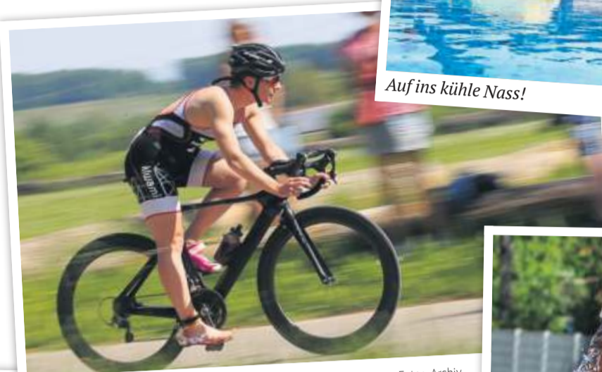
Auf dem Rad durch das Bottwartal.