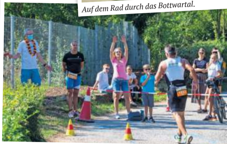
Der Triathlon ist nicht nur für die Teilnehmenden ein besonderes Ereignis, sondern auch für die Menschen, die zuschauen und anfeuern.