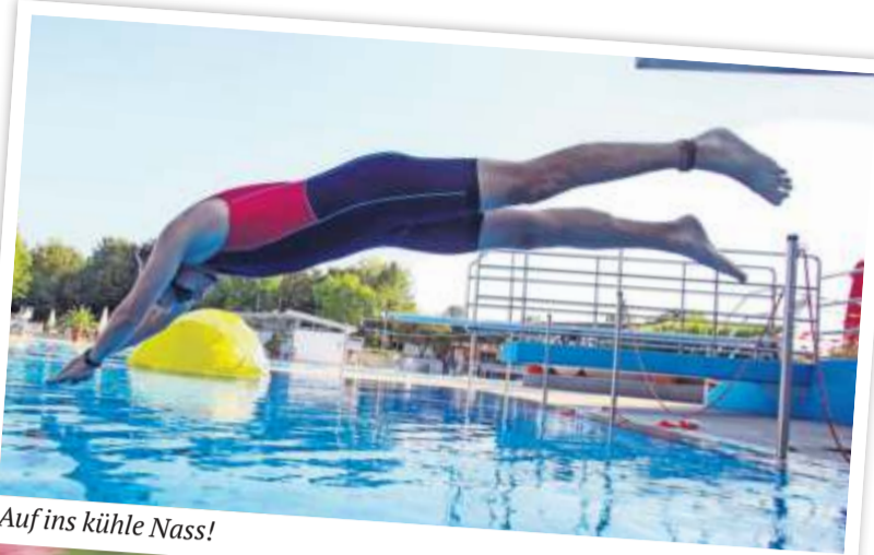
Auf ins kühle Nass!