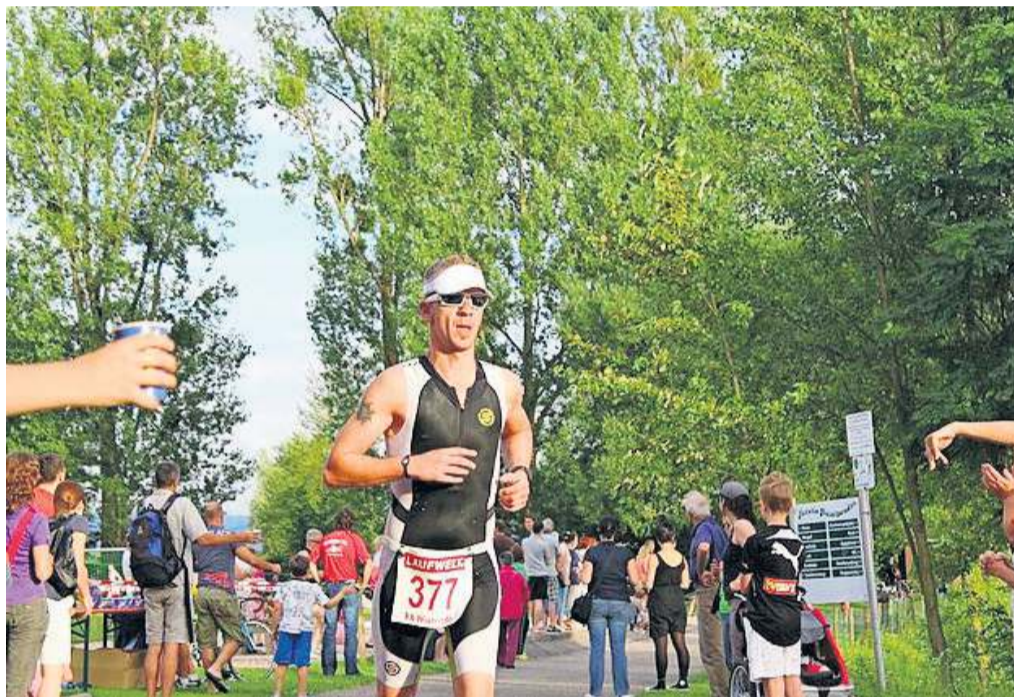
Motivation erhalten die Teilnehmenden unter anderem durch Zuschauer.

Das sportliche Schwimmvergnügen beginnt am Sprungturm und erfolgt im sogenannten Jagdstartverfahren.