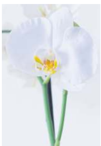
Orchideen zählen zu den Klassikern.

will, für den kann sich ein Blick auf die Webseite des Geschäfts in Sachen Annahmefristen lohnen.