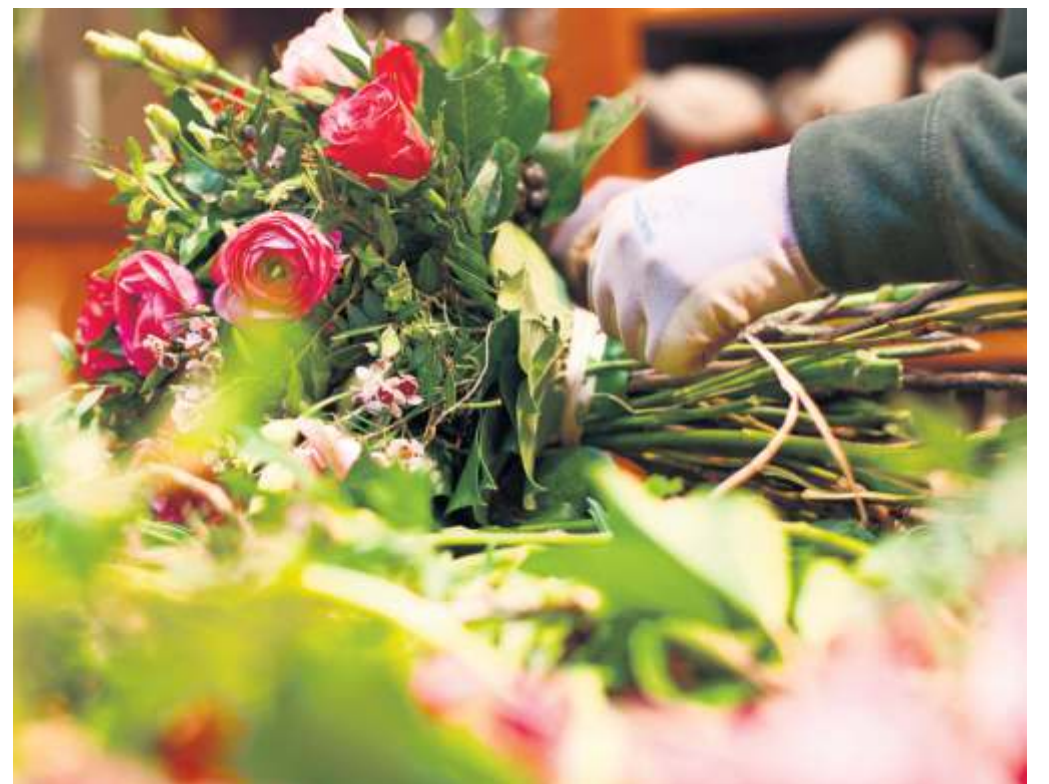
Blumen sind ein beliebtes Geschenk zum Muttertag.

Mehr rund um den Muttertag gibt es im Innenteil.